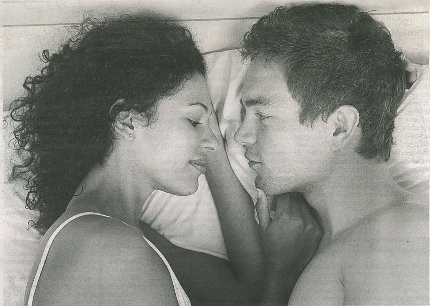
El rejuvenecimiento vaginal es uno de los procedimientos que están de moda entre las colombianas. Es más común en mujeres que han tenido hijos.

Estas quejas constantes fueron las que lo llevaron a desarrollar técnicas quirúrgicas especiales para generar cambios en los genitales femeninos. Y aunque los resultados son principalmente estéticos, Matlock insiste en que sus intervenciones están dirigidas a mejorar el desempeño sexual. Jorge García Pertúz, médico ginecólogo de la Universidad del Rosario en Bogotá y uno de los pocos entrenados por