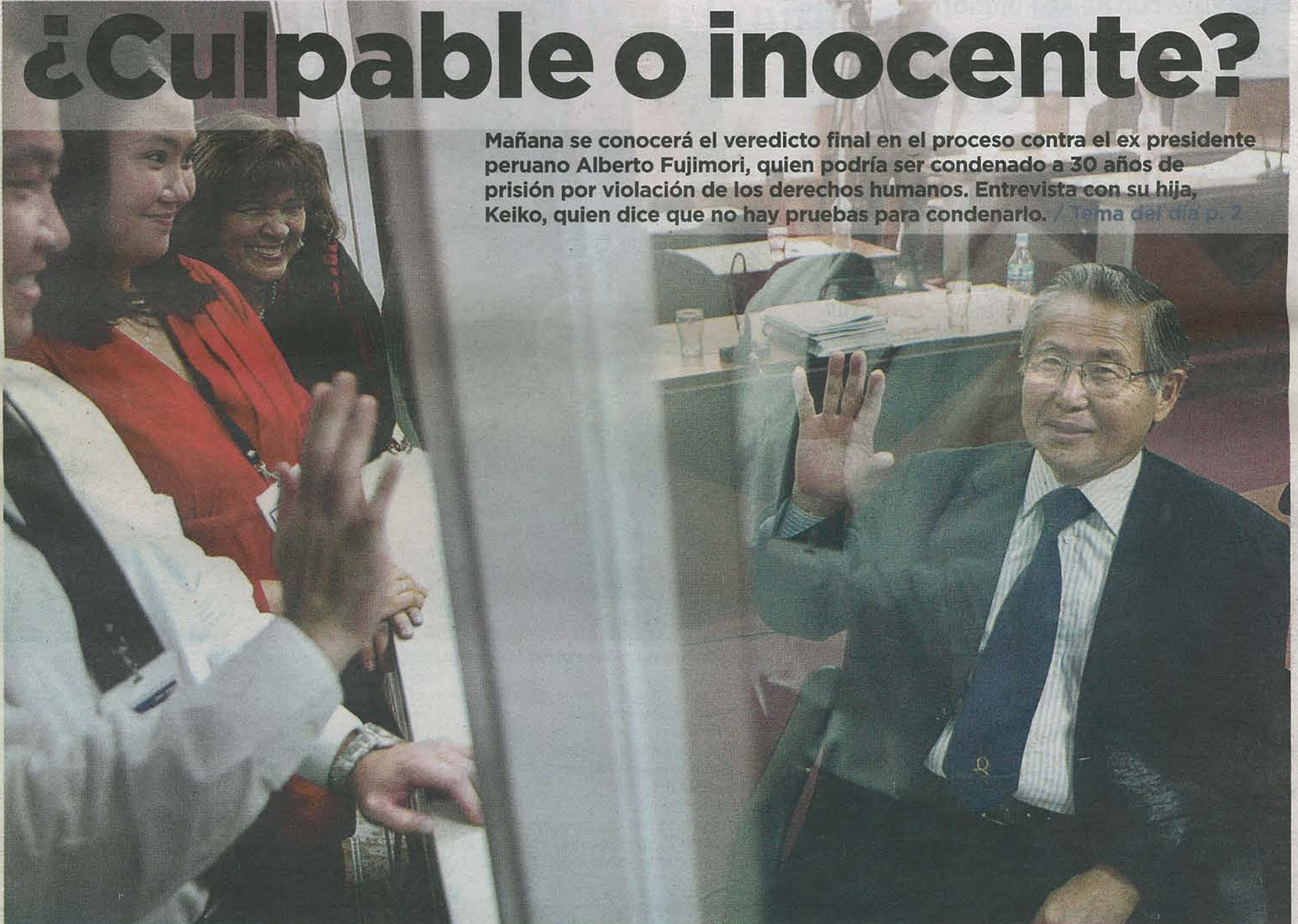
El ex presidente peruano Alberto Fujimori (der.) saluda a sus hijas Keiko (segunda izq.) y Kenyi (izquierda) en la última audiencia del juicio en su contra.

Mañana se conocerá el veredicto final en el proceso contra el ex presidente peruano Alberto Fujimori, quien podría ser condenado a 30 años de prisión por violación de los derechos humanos. Entrevista con su hija, Keiko, quien dice que no hay pruebas para condenarlo. / Tema del día p. 2